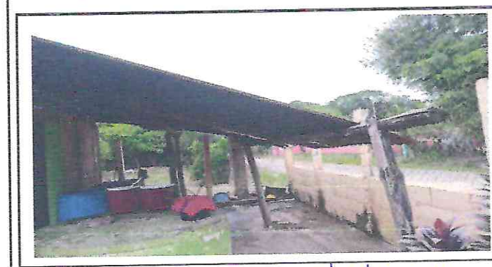
Foto 5: techo en mal estado, con parales de madera en mal estado.