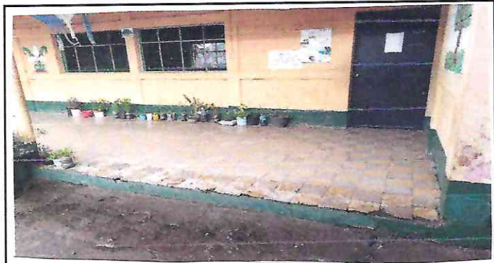
Foto 4: Segunda ventana en mal estado tiene doblada su estructura.